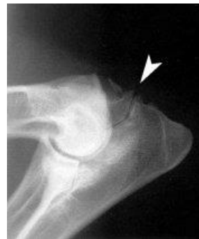
Slechte elleboog: los proces bij de pijl