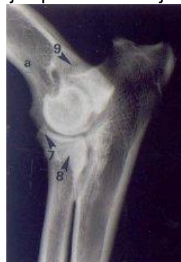
Slechte elleboog: los proces bij 8 en botaanwas (artrose) bij punten 6, 7, 9.