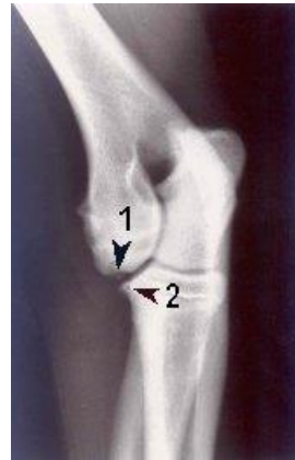
Slechte elleboog: los proces bij 1 en botaanwas (artrose) bij 2.