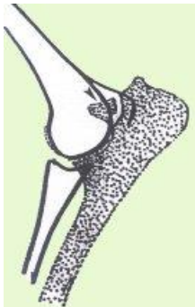
Losgebroken stukje bij de pijl.

In het ellebooggewricht, boven aan de ellepijp zit een botuitsteeksel dat normaliter aan de ellepijp vast zit en totaal vergroeid is op 5½ maanden leeftijd. Tot die tijd kan het uitsteeksel afbreken. Vooral is dit het geval als de onderarm krom groeit zoals we dat kennen bij de Basset. Dit kromgroeien kan ook bij andere honden optreden ten gevolge van een ongeluk op jonge leeftijd of overvloedige opname van mineralenmengsels. Bij verscheidene rassen werd een erfelijke predispositie (grote mate van "gevoeligheid" voor LPA bij bepaalde bloedlijnen) vastgesteld.